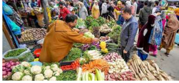
EASING PRICES. The retail inflation rate is expected to dip further, mainly on account of ease in food prices PI

The retail inflation rate was 2.82 per cent in May, which was a 75-month low. This is expected to dip further, mainly on account of easing food prices as supplies from a robust spring harvest reached markets. Although some vegetable prices are showing an upward trend on