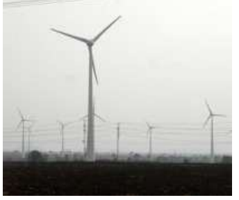
This policy can unlock India's global manufacturing potential

any significant exemptions on domestic sourcing for large ongoing projects will undermine the localisation goals, said the CEO of a leading gearbox manufacturing company for wind projects.