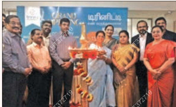
கோவை சிங்கநல்லூரில் 'டிரினிட்டி சூப்பர் ஸ்பெஷலிட்டி' கண் மருத்துவமனை புதிய கிளை தொடக்க விழாவில் பங்கேற்றோர்.