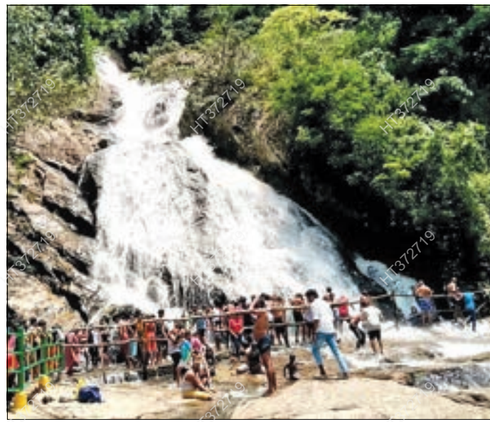
பொள்ளாச்சி அருகேயுள்ள ஆழியாறு கவியருவியில் நேற்று திரண்ட சுற்றுலா பயணிகள்.

பொள்ளாச்சி ஆழியாறு கவியருவியில் நீர் வரத்து சீராக இருந்ததால் சுற்றுலா பயணிகள் வருகை நேற்று அதிகரித்து காணப்பட்டது.